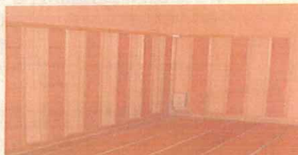
設置例：約1坪の部屋に200枚を設置

※三朝温泉のラドン濃度は、昼間や夕方の利用者が多い時間帯は、200~300 Bq/m 3 深夜の締め切った浴場では、2600 Bq/m 3 とされています。